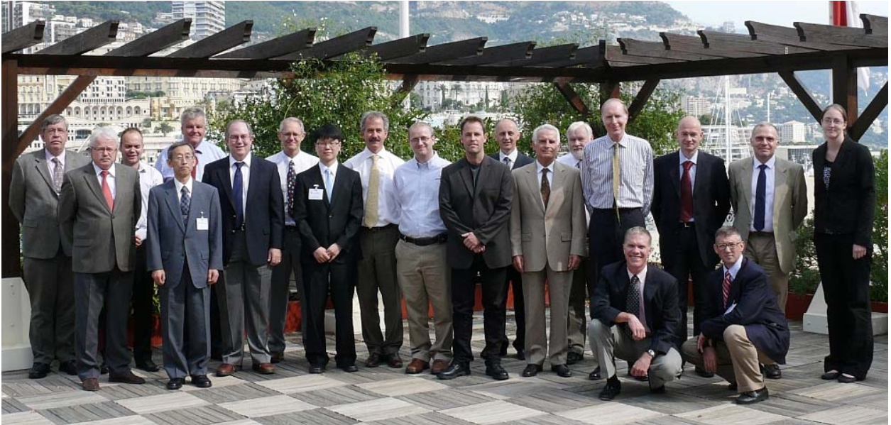
11 e réunion du SNPWG (BHI, Monaco)

La 11 e réunion du groupe de travail sur la normalisation des publications nautiques (SNPWG) a eu lieu au BHI, Monaco, du 7 au 11 septembre 2009. Des représentants du Danemark, d'Estonie, de France, d'Allemagne, de Corée, du Japon, de Norvège, du RU et des USA ont participé à cette réunion. Des participants de l'industrie venus de CARIS, de Jeppesen et de NOVACO étaient également présents.