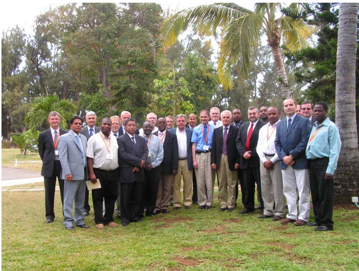
Les participants à la réunion.