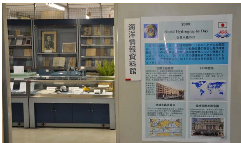
Musée hydrographique et océanographique