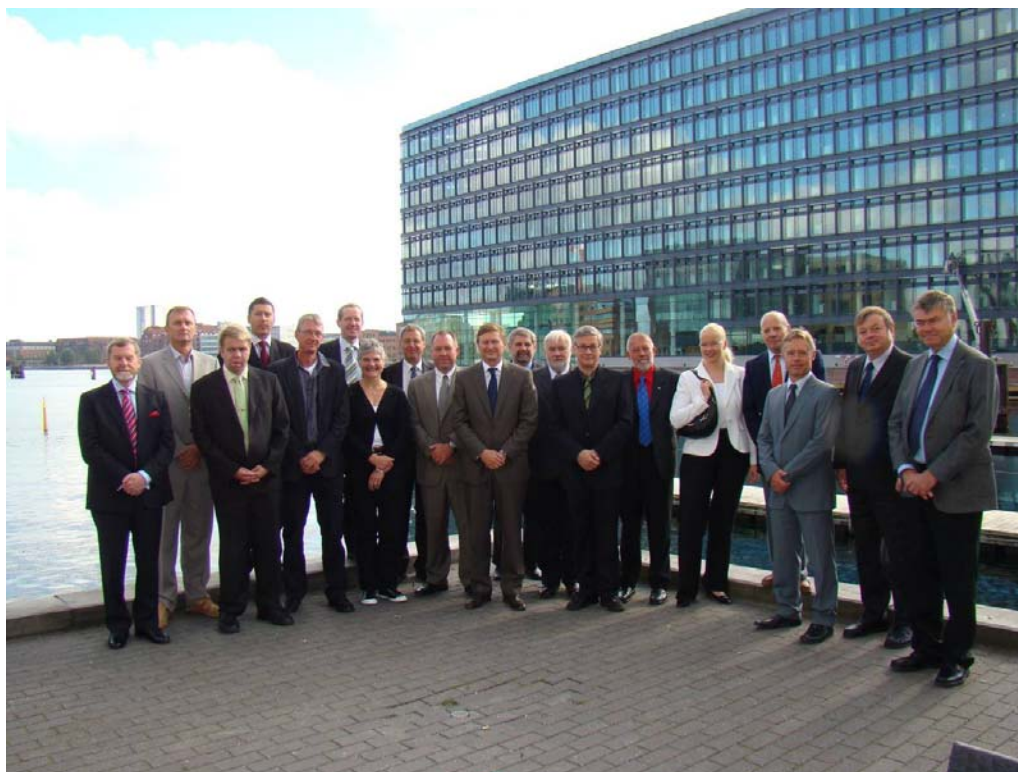
Les participants à la réunion.

Pour tous renseignements complémentaires se référer au site web du BHI – compte rendu de la 14 e conférence de la CHMB.