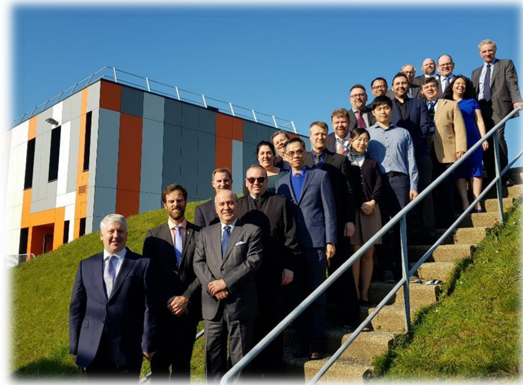
Participantes de la WENDWG-9, Shom, Brest, France

Se invita a la CHAtSO-13, a tomar nota del reporte.